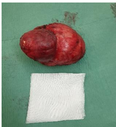
Figure 3: aspect macroscopique de tumeur phyllode bénigne chez une femme de 37 ans

L'Organisation Mondiale de la Santé classe les Tumeurs Phyllodes en 3 sous-groupes histologiques : les tumeurs phyllodes bénignes comptant pour 60 à 75% des tumeurs phyllodes (figure 3), les tumeurs phyllodes borderlines (15-26%) et les tumeurs phyllodes malignes 8-20% (4).