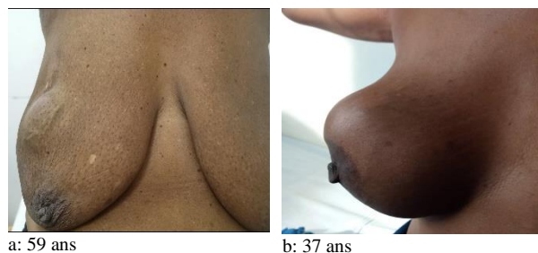
Figure 1: Aspect clinique tumeur phyllode bénigne

Sur le plan clinique, il est décrit classiquement une masse ferme, bien définie, macro-lobulée et indolore, à croissance rapide, de taille médiane autour de 4 cm (13). Dans notre série, nous retrouvons le caractère indolore et rapidement croissant chez toutes nos patientes. En termes de volume, trois des quatre de nos tumeurs étaient des tumeurs phyllodes géantes (figure 1).