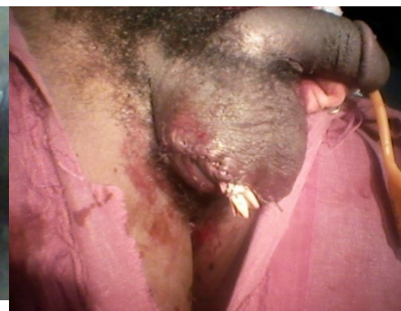
Figure 5 aspects après parage