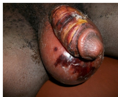
Figure 8 : gangrène des génitalia externes