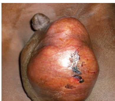
Figure 6 : cancer du testicule