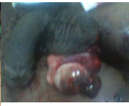
Figure 4 : extériorisation du testicule