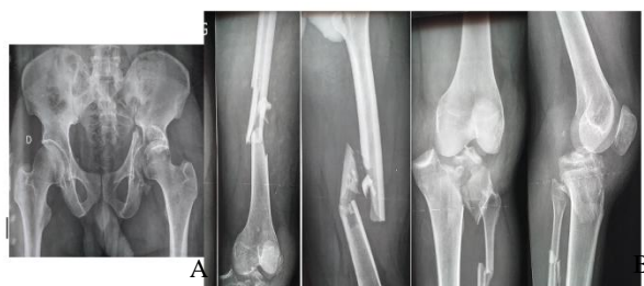
Figure 1 : Genou flottant type II b de Fraser associé à une fracture de la cotyle homolatérale A : Fracture du cotyle, B : Fracture de 1/3 supérieur de la fibula

La durée moyenne de cicatrisation de la plaie était 21 jours (15 - 75 jours).