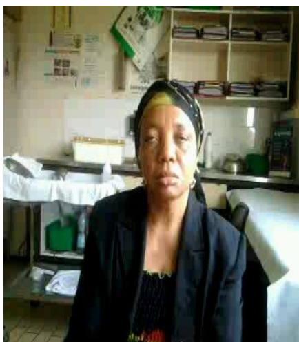
Figure 2 : Fermeture palpébrale bilatérale incomplète à la mimique

L'examen à la mimique a retrouvé une absence totale d'expression faciale, un signe de Charles-Bell bilatéral (Figure 2), une élocution difficile, une impossibilité de gonfler les joues.