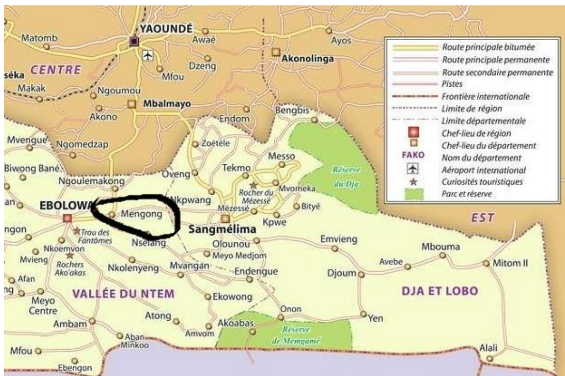
Figure 1 : Localisation du site de l'étude

Latitude 2.933, Longitude 11.417, 2° 55'59'' Nord, 11°25'1'' Est. Altitude 712 m [11].