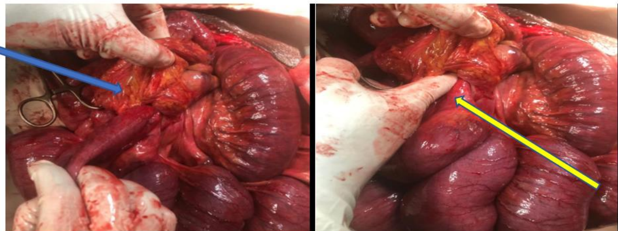
Figure 1. Image laparotomie de notre patient : peropératoire, confirmant que l'iléon s'est hernié à travers le foramen de Winslow(A) ; après réduction introduction digitale.

Une patiente âgée de 35 ans, admise aux urgences chirurgicales de l'Hôpital National de Niamey pour douleurs abdominales diffuses de survenue brutale ; vomissement post-prandial précoce et arrêt des matières et de gaz depuis 72 heures. Aucun antécédent de chirurgie abdominale ou de traumatisme abdominal n'a été retrouvé à l'interrogatoire. L'examen physique avait objectivé retrouver une défense abdominale diffuse et un important météorisme, le reste de l'examen normale toucher rectal sans particularité. Le diagnostic d'une occlusion intestinale a été évoqué. La radiographie de l'abdomen sans préparation a révélé la présence de niveaux hydroaériques de type grêlique. L'hémogramme, numération formule sanguine, glycémie, l'azotémie et la créatininémie étaient normaux. Le patient admis au bloc opératoire ou une laparotomie médiane a été réalisée en urgence. L'exploration chirurgicale avait permis de mettre en évidence l'engagement et l'incarcération d'une anse iléale dans Foramen de Winslow (Figure 3).