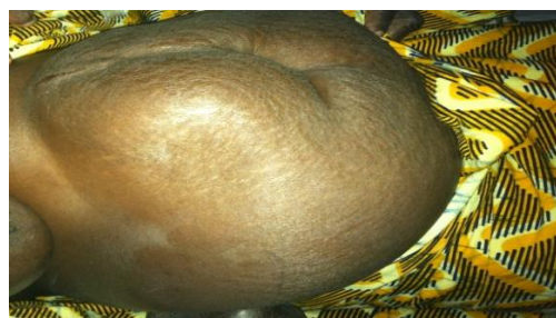
Figure 1 : volumineuse masse para et sous ombilicale droite.

Nous rapportons le cas d'une patiente âgée de 65 ans, mère de 10 enfants, obèse, présentant depuis 6 ans une masse para rectale droite en sous ombilicale, augmentant progressivement de volume, sans trouble de transit et sans altération de l'état générale. A l'examen il s'agissait d'une masse d'environ 25x12 cm, molle, non douloureuse et réductible partiellement, sans signe inflammatoire en regard (Fig. 1,2).