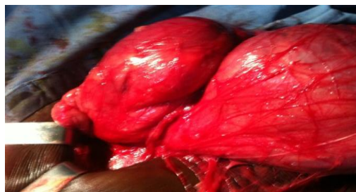
Figure 3 : volumineux sac herniaire et le large collet de la hernie

L'échographie avait suspecté une hernie de Spiegel. L'exploration chirurgicale a trouvé en sous aponévrotique un volumineux sac herniaire d'environ 30cm divisé en deux lobes contenant l'intestin grêle et l'épiploon qui étaient viables (Fig. 3).