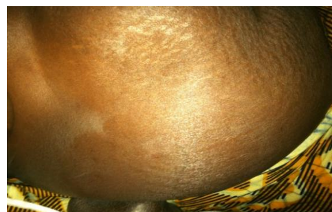
Figure 2 : volumineuse masse para et sous ombilicale droite.