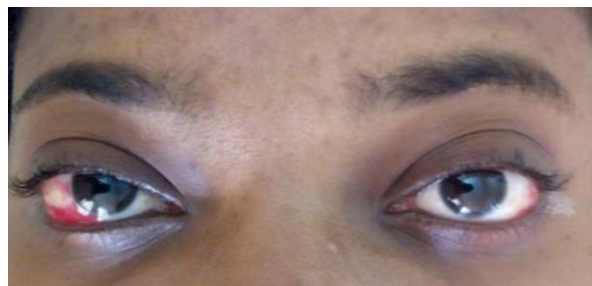
Figure 1 : hémorragies vitréennes bilatérales

Il s'agissait d'une patiente de 29 ans, admise en urgence pour céphalée d'installation brutale, associée à une perte de connaissance de durée brève et un trouble visuel. L'examen clinique réalisé a révélé : des signes d'hypertension intracrânienne, une photophobie, une phonophobie, une hémorragies vitréennes bilatérale ( Figure 1 ) et une baisse de l'acuité visuel.