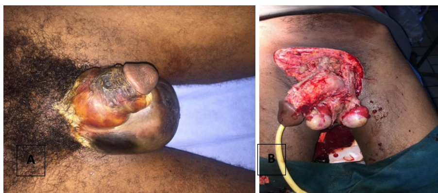
Figure 2 : Gangrène de Fournier

Les infections urogénitales apparaissent diverses et variées dans toutes les études mais sont dominées dans notre étude par les Gangrène de Fournier (11%) (Figure 2 A) tout comme dans l'étude menée par Tfeil et al [9], mais contrairement à Diabaté et al [6] où elles sont dominées par les orchio-épididymites aiguës. L'abcès périnéal a été la principale étiologie et la majorité des patients étaient diabétiques avec notion de mauvaise observance au traitement. Ces constats ont également été faits par Rimtebaye K et al au Tchad en 2009 [12]. Le traitement reposait sur une bi ou triantibiothérapie et sur des débridements chirurgicaux (Figure 2 B).