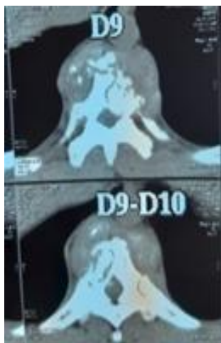
Figure 1 : TDM dorsal en fenêtre parenchymateuse objectivant une spondylodiscite D 9-D 10 en coupe axiale

L'IRM du rachis dorsal est pratiquée chez un patient soit 1,66 % des cas, le myéloscanner du rachis dorsal a été le gold standard pour notre diagnostic, pratiqué chez 28 patients soit 46,66 % des cas, il a mis en évidence l'épidurite tuberculeuse. 16 patients soit 32 % des cas ont bénéficié d'un scanner simple et 5 patients soit 10 % cas d'une simple radiographie standard par manque de moyen financier.