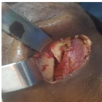
Figure 1 :Image opératoire d'une fracture unifocale parasymphysaire de la mandibule

Les signes cliniques associés au traumatisme de la mandibule étaient représentés par des œdèmes périorbitaires (48,2%), des ecchymoses en lunette (23,2%)