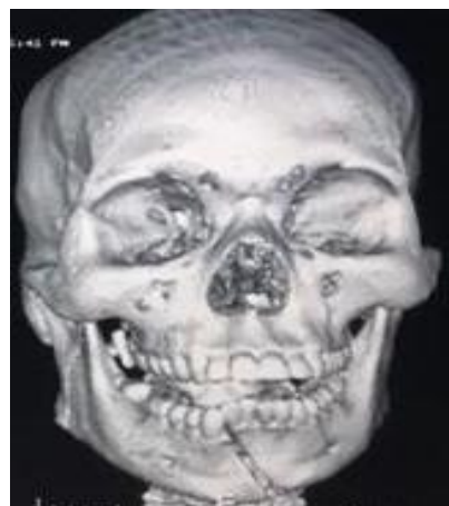
Figure 4 : TDM du massif facial montrant une fracture symphysaire gauche de la mandibule

L'exploration à la TDM a montré que chez 19 malades (33,9%), le trait de fracture était sur le corpus mandibulaire, chez 14 patients (25%) le trait était sur la région para-symphysaire tandis que 11 traumatisés (20%) avaient un trait de fracture sur le ramus mandibulaire.