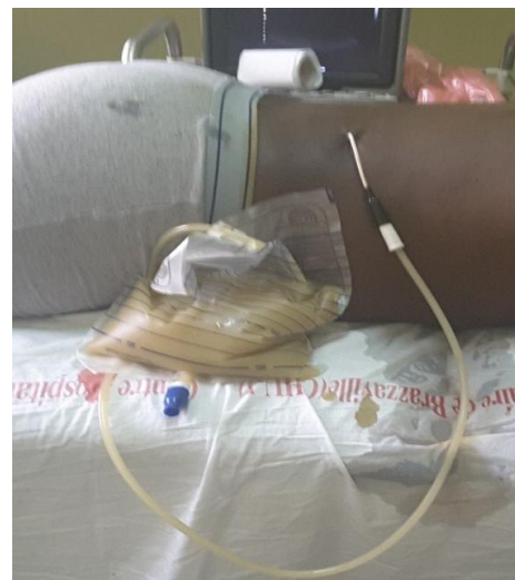
Figure 3 : Drainage rénal par néphrostomie

Le drainage rénal préopératoire par néphrostomie percutanée échoguidée (Figure 3) avant néphrectomie a été réalisé dans 12 cas (52,2 %). La fonction rénale s'était normalisée au bout de deux semaines chez 1 patient (9,1 %), le traitement dans ce cas était une chirurgie conservatrice notamment une pyéloplastie.