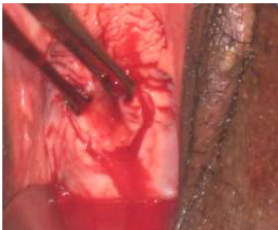
Figure 4 : incision périfistulaire