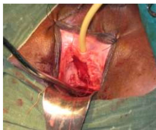
Figure 7 : Résultat après la suture