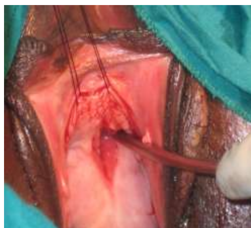
Figure 3: Prélèvement du lambeau