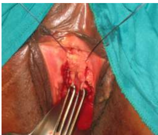
Figure 6: le lambeau est rabattu et suturé