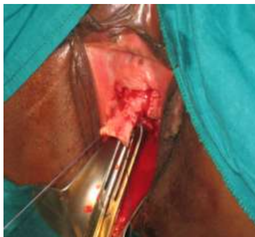
Figure 5: présentation du lambeau