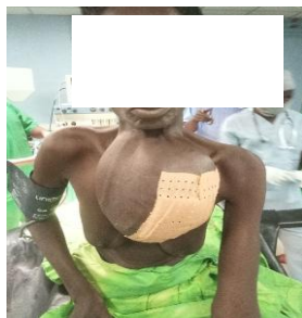
Figure 1 : vue de face