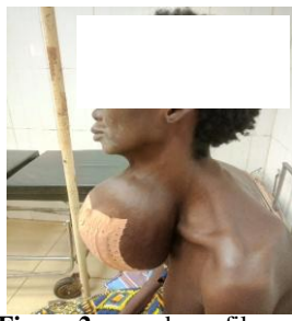
Figure 2 : vue de profil