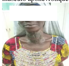
Figure 6: Cicatrisation

L'examen anatomo-pathologie de la pièce opératoire a conclu à un goitre micro-vésiculaire remanié par l'inflammation et l'ulcération cutanée. Les suites opératoires à un mois et à trois mois étaient normales. Le contrôle hormonale (FT4, TSHus) ainsi que la calcémie étaient normaux.