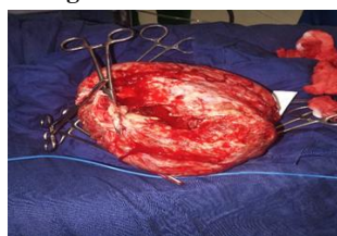
Figure 5 : pièce opératoire