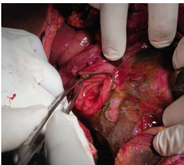
Figure 2 : Plaie de la face antérieure du genu inferius