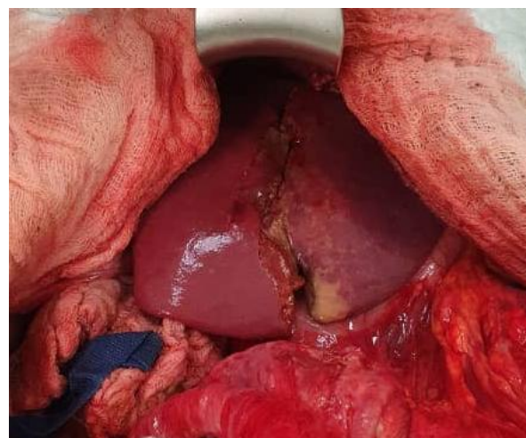
Figure 4 : Plaie du foie