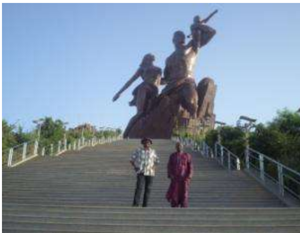
Vue du monument de la renaissance africaine (52m). L'on y accède au bout de 198 marches.

Le programme social comportait la visite du monument de la renaissance africaine, inauguré en 2010 par le Président sénégalais Abdoulaye Wade et une visite du site historique de Gorée, l'île aux esclaves au large de Dakar.