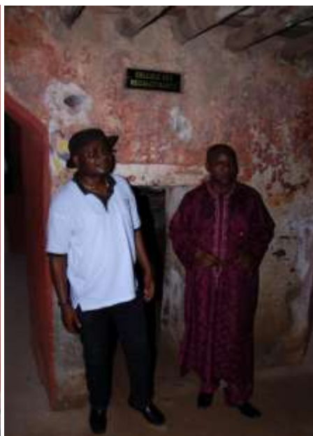
Site historique de Gorée : « Cellule des récalcitrants »