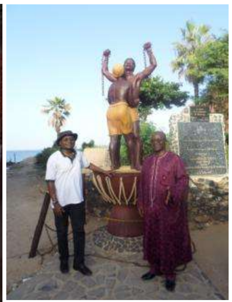
Site historique de Gorée : « Les chaînes sont brisées »