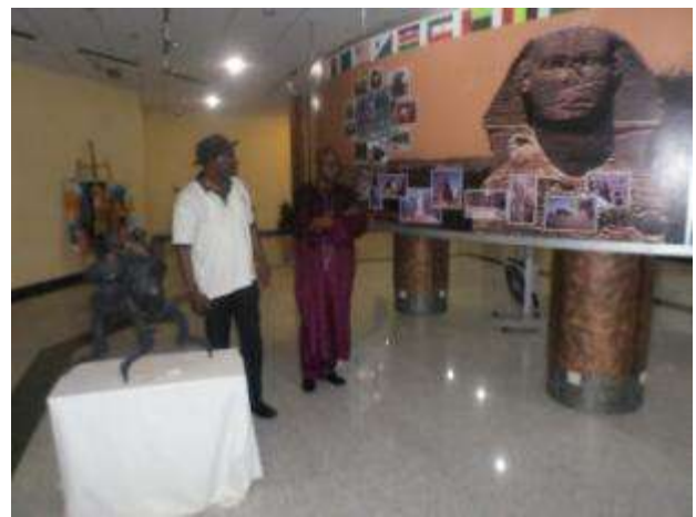
Il y a un musée situé au cœur du monument de la renaissance africaine.