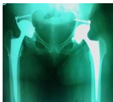
Figure 3 : aspect radiographique de contrôle d’une PTH bilatérale à double mobilité

Les caractéristiques épidémiologiques des patients sont détaillées dans le tableau 1. L’âge moyen était de 55,2±14,7 [20-87] ans. Il y avait 81 (55,9%) hommes et 64 (44,1%) femmes, donnant une sex-ratio H/F de 1,3. Selon les comorbidités retrouvés: 70 (48,3%) drépanocytaires dont 41 types SS et 26 types SC ; 37 (25,5%) hypertendus, le 21 (14,5%) diabète, 12 (8,3%) VIH positifs. Les autres comorbidités (7,6%, n=11) étaient : l’asthme (n=3), une cardiopathie (1,4% ; n=2), une dyslipidémie, une néphropathie, une dépression, une hypertrophie bénigne de la prostate, une poliomyélite aiguë, un trait drépanocytaire.