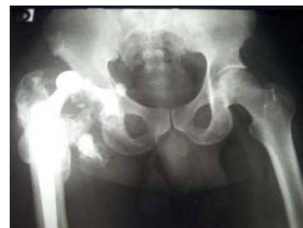
Figure 4 : aspect radiologique d'une luxation antérieure sur prothèse totale de hanche

Le recul moyen était de 54 \pm 21,6 [6-60] mois. Dans notre étude 10 (6,8%) patients ont présenté une complication peropératoire à type de choc hémorragique due à la spoliation sanguine. Ils ont été traités par transfusion sanguine. Il n'y a eu aucun décès peropératoire. L'ensemble des complications ont représenté 8,1% (n=12). Elles comprenaient : 1 (0,7%) cas de luxation (figure 4) précoce chez une femme opéré par voie postéro-externe qui a été réduite sans changement de la prothèse ; 1 (0,7%) cas de pneumopathie alvéolaire ayant été traité par antibiothérapie adapté durant 14 jours ; 2 (1,4%) infections (VIH négatif) respectivement à 60 et 90 jours par Staphylococcus aureus ayant été traité par lavage avec changement de la tige fémoral prothétique et antibiothérapie adaptée ; 8 (5,4%) descellements dont 2 septiques (VIH positif) et 6 descellements non septiques (VIH négatif) qui ont été repris. Une patiente (0,7%) était décédée par accident vasculaire cérébrale à 03 mois post-opératoire