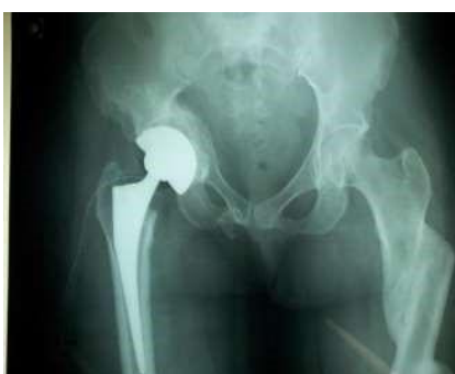
Figure 2 : aspect radiographique d’une prothèse totale de hanche à double mobilité.

CHU SO = CHU Sylvanus Olympio. CCL = Clinique chirurgicale de Lomé. HSJDA = hôpital St-Jean de Dieu d’Afagnan