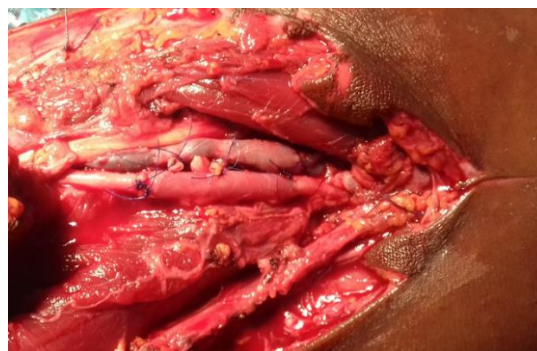
Figure 4 : Vue per opératoire d'une réparation d'une section complète de l'artère brachiale par un pontage veineux avec un greffon de veine céphalique

Les autres gestes associés secondaire étaient : une ostéosynthèse pour une fracture du massif carpien (1 cas), une réparation des tendons des fléchisseurs palmaires superficiels et profonds (2 cas) ; une aponévrotomie prophylactique (11 cas).