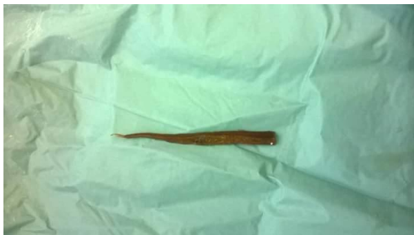
Figure 4 : extraction d'un morceau de poids, perforation gastrique

des sueurs froides. L'examen clinique notait une contracture abdominale. L'échographie avait mise en évidence un épanchement péritonéal abondant. Le bilan biologique était normal, un groupe sanguin O positif. Nous avons procédé à une laparotomie, qui mettait en évidence une perforation de la face antérieure de l'antrum gastrique de 5 cm de diamètre, puis retrait d'un corps étranger (morceau de bois 11 cm), enfin suture du pertuis, lavage et drainage. Les suites ont été simples après un séjour en réanimation.