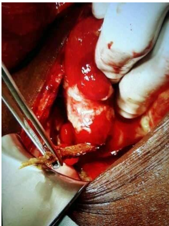
Figure 1 : perforation colique sigmoïde, retrait du bois