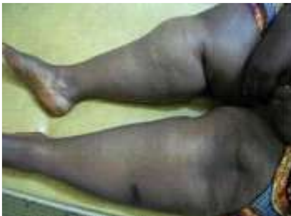
Figure 2. Aspect patent d'un myxœdème sur hypothyroïdie chez une patiente de 37 ans présentant une grosse jambe bilatérale avec un œdème ne prenant pas le godet (Service de médecine interne, HNN).

Nous avons retrouvé la bradycardie dans 9 cas (81,80%) ; le myxœdème chez 8 patients (72,70%); la prise de poids chez 8 patients (72,70%). L'asthénie, la constipation et l'hypothermie étaient retrouvées à la même fréquence de 63,60% soit 7 cas chacun. Le ralentissement psychomoteur et les crampes ont été retrouvés dans respectivement 27,30% (3 cas) et 36,40% (4 cas). La photo 5 montre un cas de myxœdème sur hypothyroïdie chez une patiente de 37 ans.