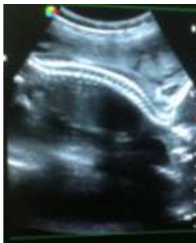
Coupe longitudinale d'un rachis fœtal normal donnant la classique image dite « en double rail »