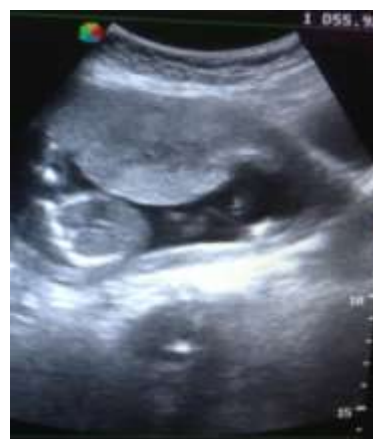
Image montrant un placenta antérieur grade II de Granum