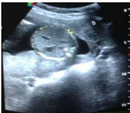
Mesure du périmètre abdominal et du diamètre abdominal transverse (calipers en place) sur une coupe axiale fœtale passant par le foie, la vésicule biliaire, le tronc porte et l'estomac