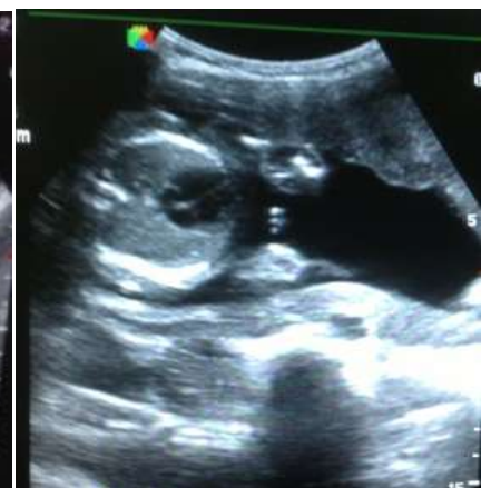
Coupe axiale thoracique passant par les quatre cavités cardiaques fœtales