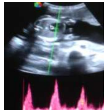
Doppler pulsé sur les cavités cardiaques.