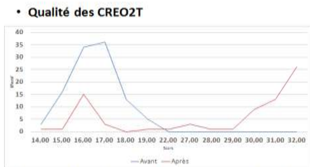
Figure 3: Courbe de distribution des scores des CREO2T avant et après l'intervention.

Min: minimum. Moy: moyenne; Med: médiane; ET: écart type; Max: maximum.