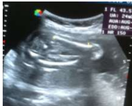
Mesure de la longueur du fémur sur une coupe fœtale passant par l'axe longitudinal des fémurs.