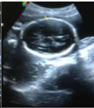
Coupe axiale céphalique fœtale passant les ventricules latéraux, les thalami et sur laquelle sont mesurés le diamètre bipariétal et le périmètre céphalique